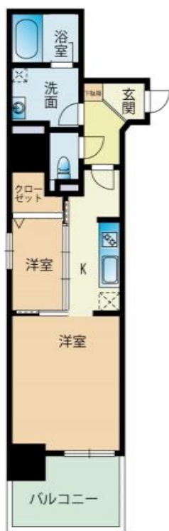
B type (1LDK) 専有面積: 34.79㎡